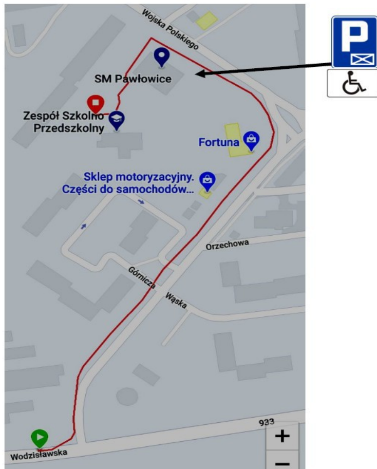
Mapa nr 1

W odległości ok. 100 metrów od wejścia głównego do przedszkola (przy budynku Spółdzielni Mieszkaniowej Pawłowice) znajduje się miejsce parkingowe przeznaczone dla osób niepełnosprawnych.